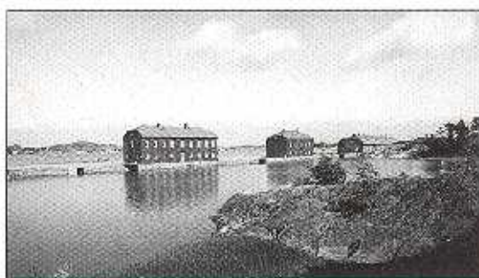
Känsö, Karantän med karaktär

Bakom graven sluter sig skogen åter och övergår nu till en blandning av snår och tall. Efter att ha forcerat ett buskage ser man det mest bohuslänska som finns, mjuka, karga klippor som möter havets vita skummande vrede. Synen försvinner snart när än en