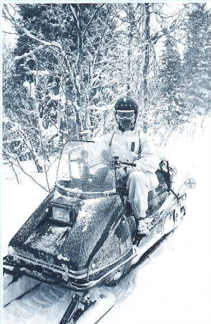
2000 talets vintersoldat