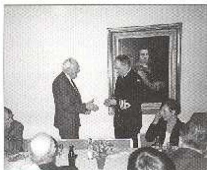
Tack Bengt för allt Du gjort!

bli en alla svenskers dag. Det talas om nya svenskar, invandrade svenskar m.m. Har man bosatt sig i Sverige, och accepterat att vara vårt land troget är man givetvis svensk! Alla har vi invandrat efter det att inlandsisen