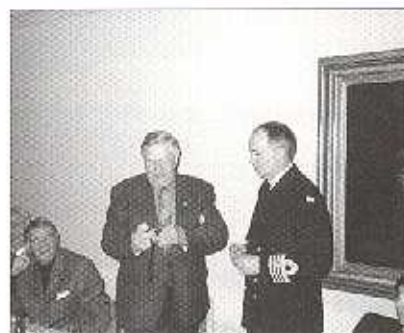
Förnämligt förtjänstecken förevigas

Som vanligt ett väl arrangerat möte med god mat och trevligt umgänge i glada vänners lag.