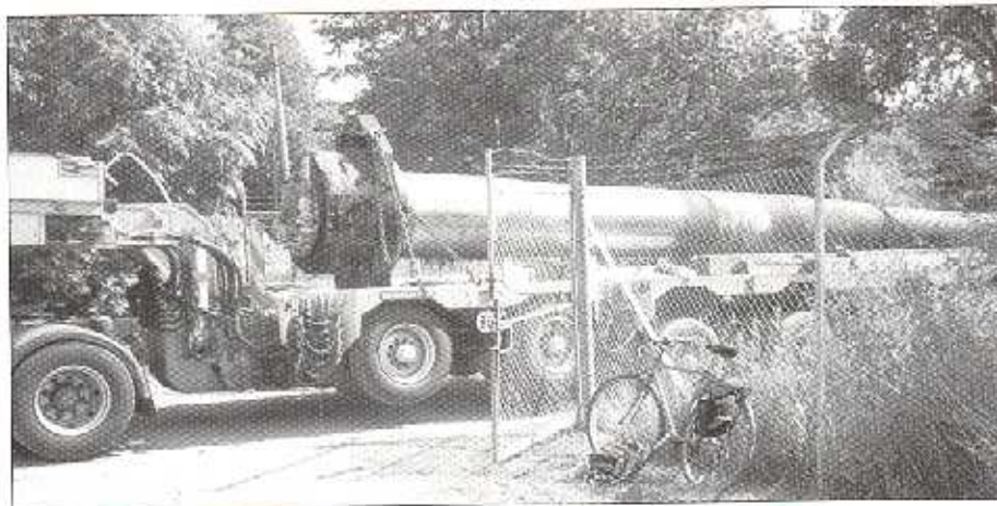
En pjäs eldrör på väg ut från Hysviks batteriområde.....

I förra numret av KA-fyren berättade jag om att 24 cm pjäserna var på väg att flyttas från Torstlanda tillbaka till Oskar II Fort.