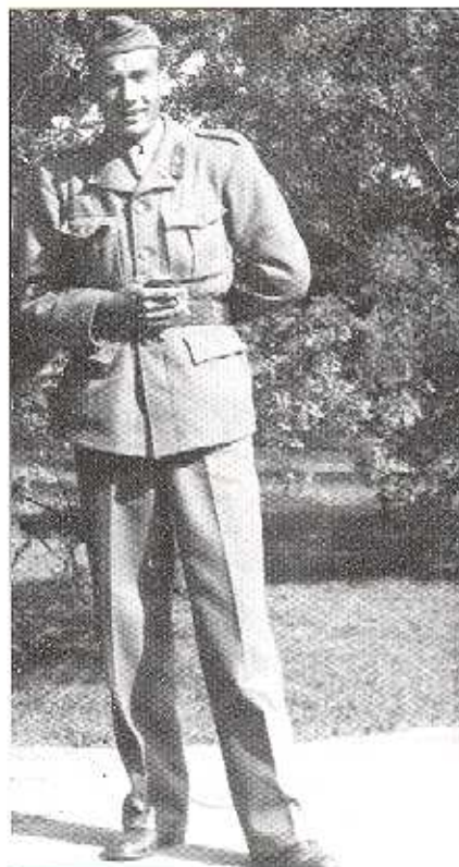
Artikelförfattaren i full mundering på den tid "det begav sig".

bildning. Det var förvånansvärt torrt och varmt i bergrummen, men så hölls avfuktning- och värmeaggregat igång ännu i denna tid. Ödsligare, tystare och mer tomt var det, än då det begav sig för drygt ett halvt sekel sedan.