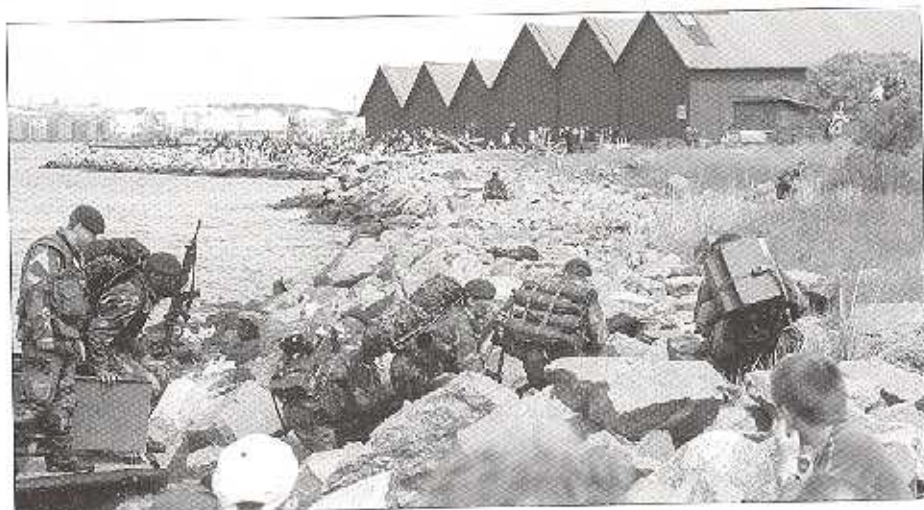
Amfibie landstiger bifför många ivresserade åskådare i KA 4 hamn

Vid försvarmaktens dag utgörs grundstommen av ett antal fasta aktiviteter som skall pågå över tiden. Dessa fasta aktiviteter utgörs av ma-