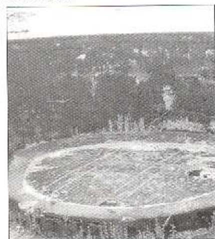
och här är nya pjäsplatsen i O II Fort