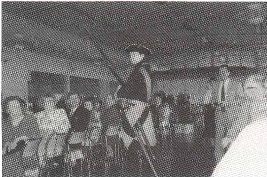
1991 - Från festen vid Kamratföreningarnas möte i Göteborg

KUSTARTILLERIETS KAMRATFÖRENING GÖTEBORG