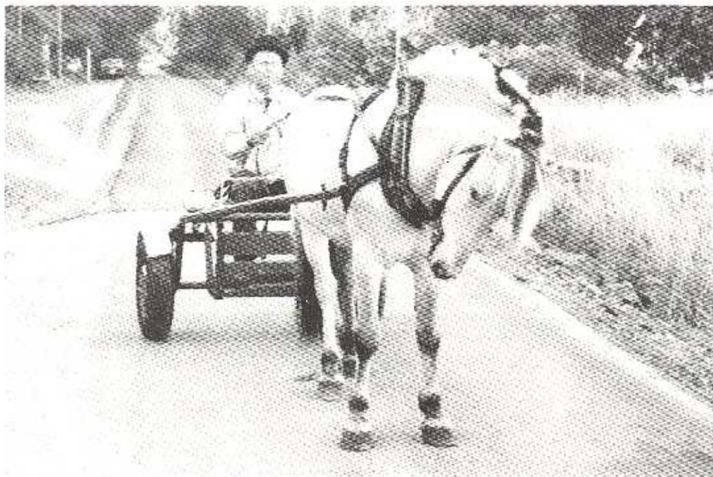
Hästkaren i full aktion

Dock, uppeppad av mina arbetskamrater, beslöt jag att, mot alla odds, ta hem öket på egna ben, hans alltså. Kl 18.00 startades hemfärden via en annan route för att slippa den täta eftermiddagstrafiken och den där lösaktiga mårren i Önnered. Då, ..... var det hänt igen. Han tappade en sko, vänster fram. På grund av begynnande trötthet hos oss bägge och hästkrakens håla, utgjorde vi säkerligen en beklämmande syn i stans västra stadsdelar. Ytterligare en sko lossnade i Askim. Höger bak. Hästen såg inte klock ut och jag kände mig som Don Quijote i "Riddaren av den sorgliga skepnaden". Vid Askimbadet rastade jag hos goda vänner, men varken socker eller vatten passade öket. E mötte upp med öl och havre (ölet till mig) men inte heller havren godtogs. Han bara slokade med huvudet och haltade vidare mot det hägrande stallet och vilan. Det tog flera dagar innan hästen blev häst igen och för min del satt sviterna i resten av sommaren. Sensmoral: "Stor i orden, faller ofta själv däri", eller hur det nu skall vara. S.E.