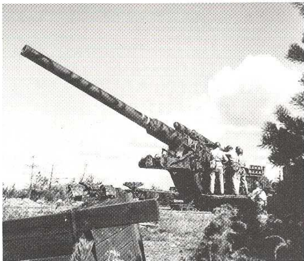
21 cm kanon M/42

KUSTARTILLERIETS KAMRATFÖRENING GÖTEBORG