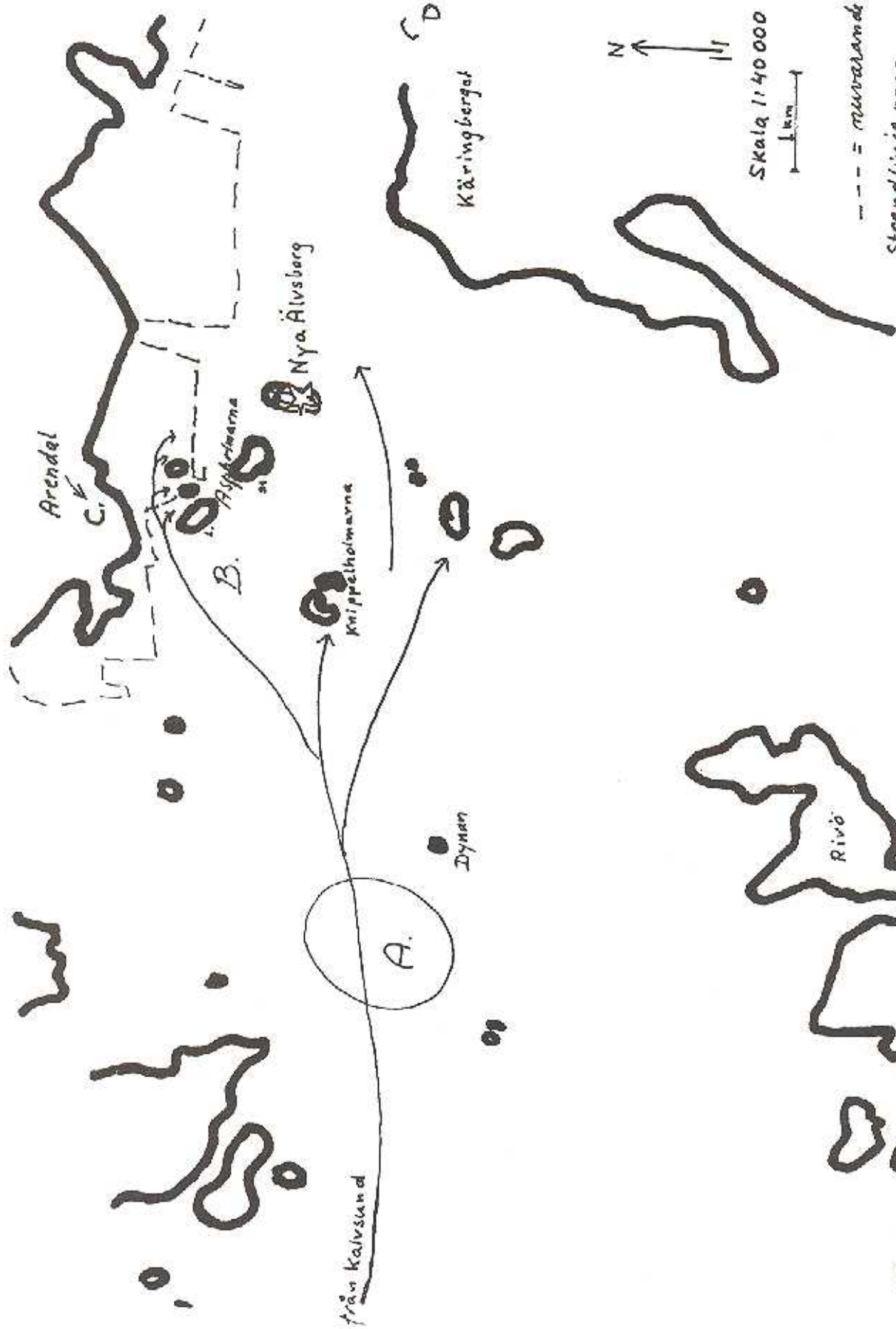
Bild 1. Tordenskjolds anfall på Nya Älvsborg 20-24/7 1719 A. Ankringsplats för blockadflottan, 5 linjeskepp och ett sjuttiofotal underhållsfartyg. 18 anfallsfartyg fortsatte. B. Pilarna visar de anfallande fartygens väg till sina platser. C. De svenska batterierna, som anlades natten till 24/7