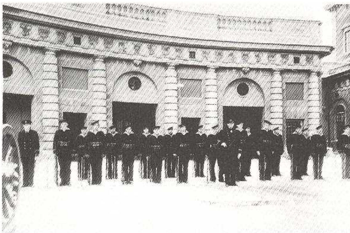
1936 - Kustartilleriet går högvakt

"Jag är gräsänka" viskade hon. "Jag är trädgårdsmästare, så det passar fint" sade han.