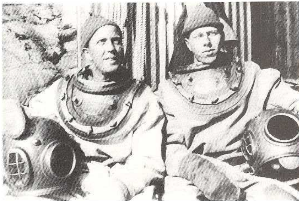
Klart för dykning. Författaren t.v.