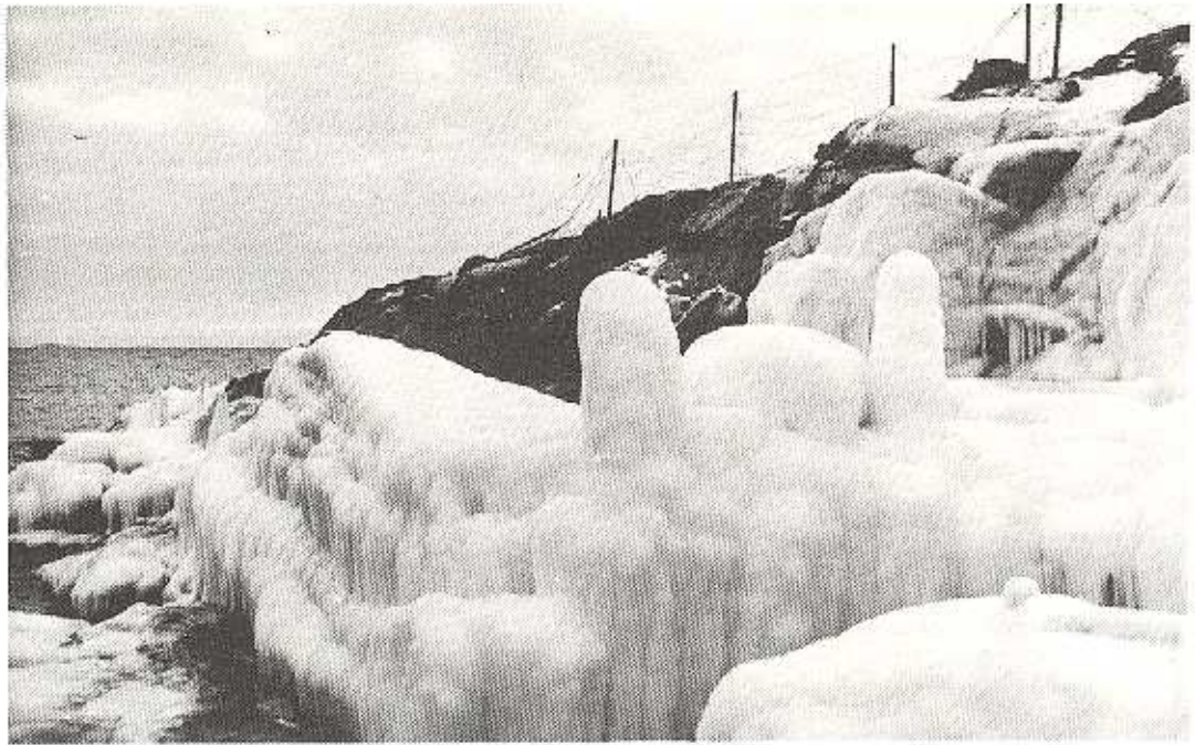
1941 - Stämningbild från heredskapen

KUSTARTILLERIETS KAMRATFÖRENING GÖTEBORG