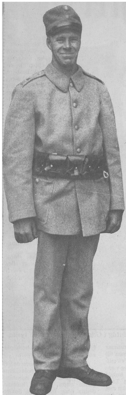
Många fick se sina söner och män uttagna i mobiliseringen denna eftermiddag.

— Lyssnar du? Här, smör för 3:25 kilot, ost 1:50, kaffe 1:95 och äggen 1:75 dussinet rabblade hon samtidigt som hon krängde på sig dräktjackan.