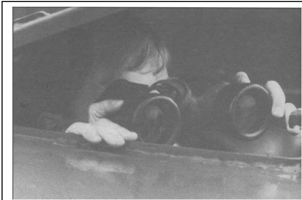
Vedettbåtarnas uppgift är bland annat att lokalisera och övervaka sjöfarten från Skagen ner till sunden mot Östersjön