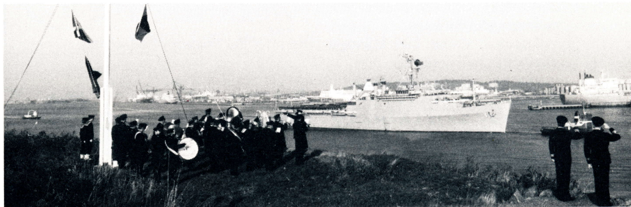
... och årets sista örlogsbesök USS Raleigh.