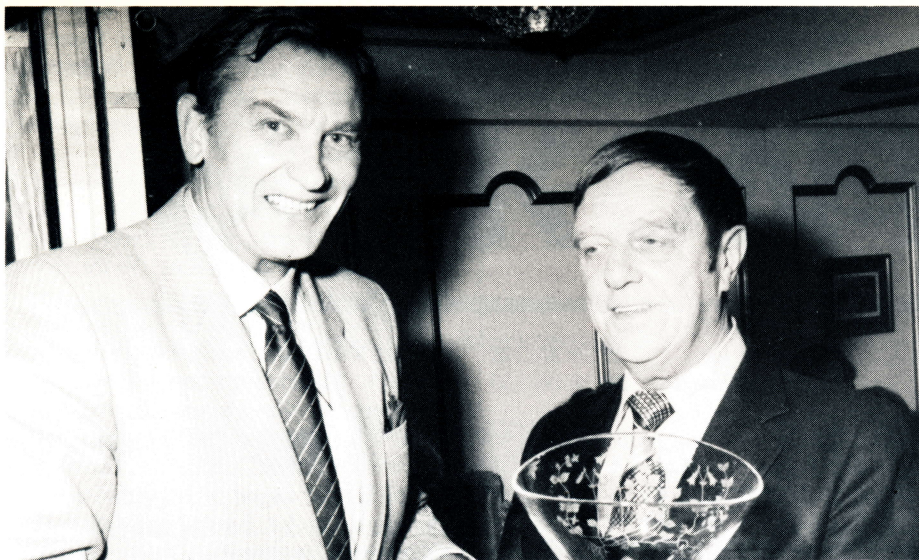
Från Danmarksresan med NOR-atiore och pensionärer. SKÅL!