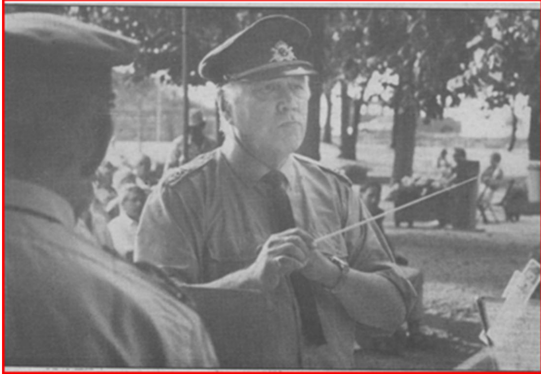
Kjerrman höll takten och ledde allsång

VARBERG: Bockanal-festivalen fortsatte i Varberg över helgen med massor av människor vid de olika aktiviteterna.