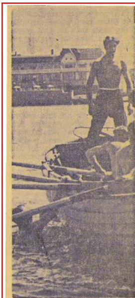
Den stackars slavdrivande styrmannen i den norska båten har plågat sina kamrater till segern, och när de efter att ha skurit mållinjen får släppa årorna kastar de honom på god sjömanssed över bord,

Danskarna hade det här besvärligt med de tunga svenska båtarna och de långa årorna - de är vana vid korta åror som ger snabba knyckiga