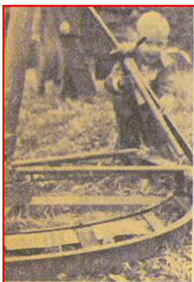
Att snurra på granatkastaren var lika skojigt som att åka karusell.

På fältet nedanför matsalen visade motorcyklisterna prov på en häpnadsväckande akrobatisk färdighet, när de körde genom vattengropar och diken, stående på sitsen eller med fyra man på en cykel.