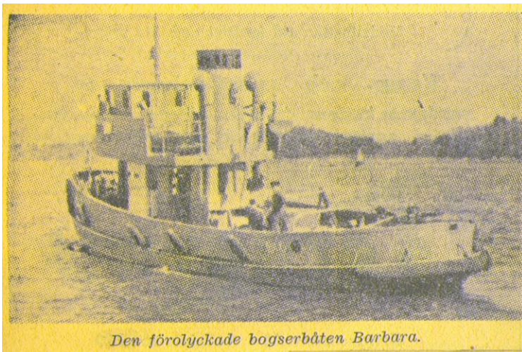
Den förolyckade bogserbåten Barbara.

GÖTEBORG 29 aug. - (ST) Nio unga kustartillerister från KA 4, i Göteborg är borta efter en storm katastrof mellan Vinga och Brännö på tisdagskvällen. Bogserbåten Barbara, en av regementets nyaste, var på väg in till Göteborg i 24 sekundmeters storm, när två väldiga brottsjöar pressade den i djupet, Olyckan, inträffade utanför Galtö nära Böttö fyr.