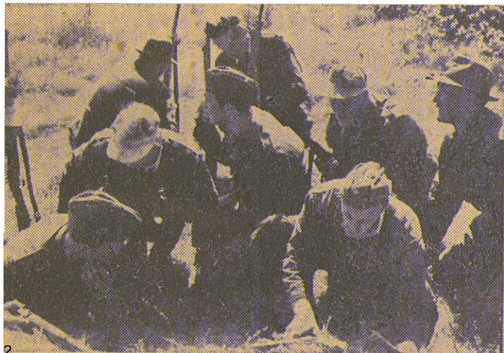
2. Det segrande laget från KA 4 samlar sig till nästa skjutmoment