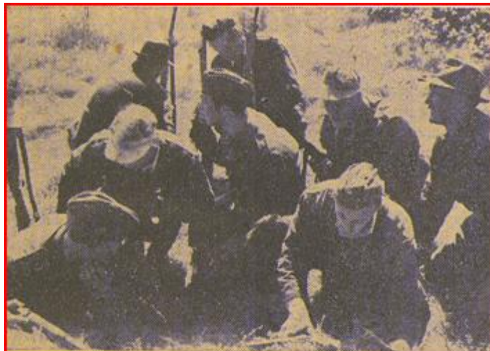
Det segrande laget från KA 4 samlar sig till nästa skjutmoment