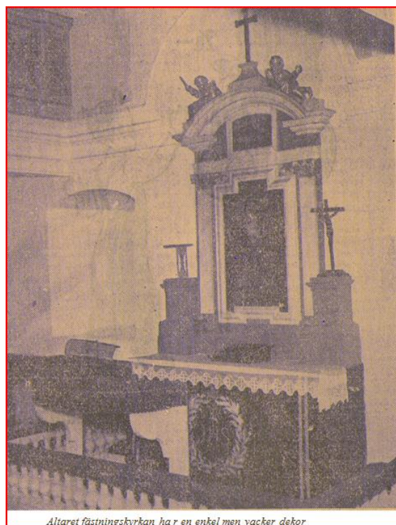
Altaret fästningskyrkan har en enkel men vacker dekor