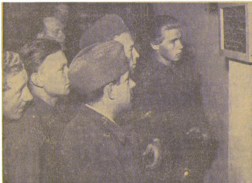
Matsedeln studeras innan mannarna kliva in i den lyxhotelliknande