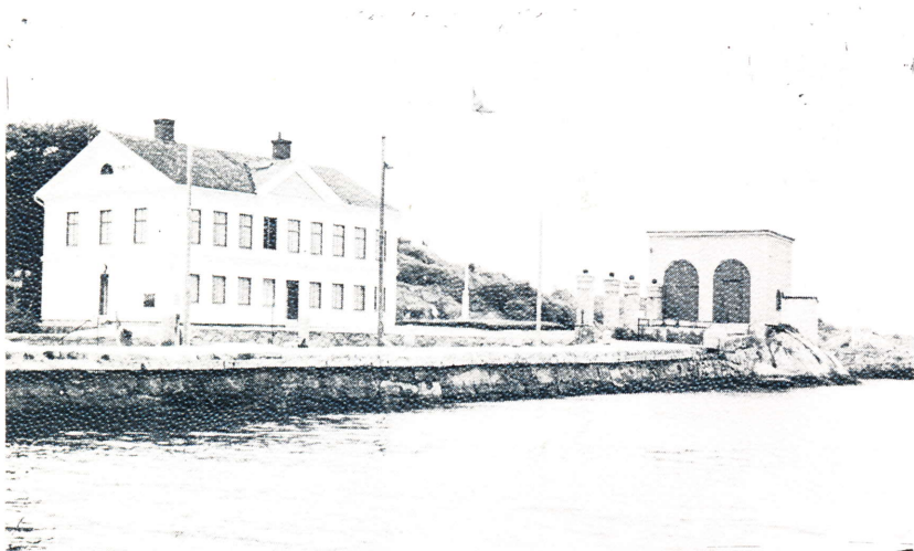
Chefshus och parloir

Ett batteri anlades redan 1805 på berget vid hamnen. Det finns kvar. Kanonerna är dock icke de ursprungliga. De nuvarande bärgades från sjöbotten för några år sedan.