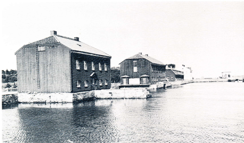
Observationssjukhuset (t v) och pestsjukhuset

Chefshuset uppfördes som en tvåvåningsbyggnad i herrgårdsstil. Det är vitmålat på de tre sidor som vetter mot sjön och rödmålat mot land. Där bodde karantänsbefälhavare, läkare m fl.