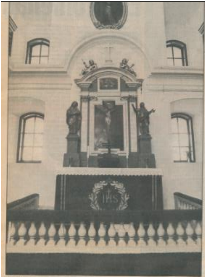
Det är inte sällan regeligt som belys som blickar ned på altaret i Söndagskyrkan på Nya Älvborg. Det här till exempel från Karl XII - minnet av den kyrkans.