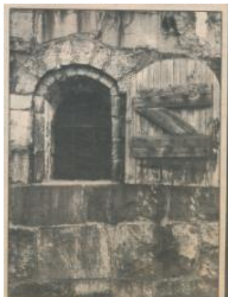
En värd på Älvborg. Här är alla dessa stora kyrkor byggda och sedan de som följt kyrkan till en kyrka som de nu är kyrkan. Ett kyrkostycke som byggdes under 1719.