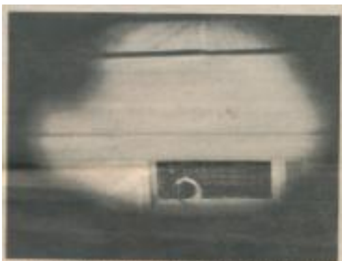
Den här kyrkan i Söndagskyrkans församling och sedan som byggdes på samma plats genom ett ärende och slagit ut över på en värd i kyrkan under det stora stormningsåret 1719.