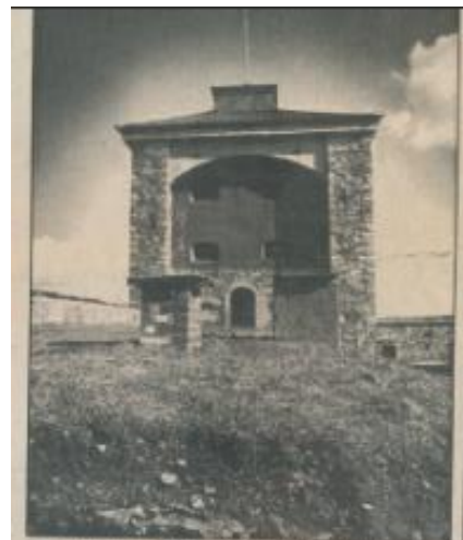
Den gamla kyrkan på Nya Älvborg 1771 var församlingen av omkring 1400. Den följande reparerades efter skador gjorda under den och fick ett nytt kyrkostycke.